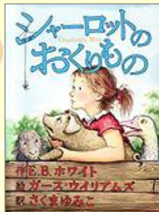
『シャーロットのおくりもの』 E.B.ホワイト／作 ガース ウィリアムズ／絵 さくま ゆみこ／訳 あすなろ書房

農場の納屋に住む、子ブタ のウィルバーとクモの シャーロット。食べられて しまいそうなウィルバーを 助けるためにシャーロット が考えた作戦は？