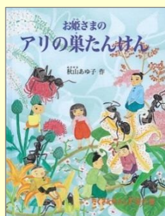
『お姫さまのアリの巣たんけん』 秋山 亜由子／作 福音館書店