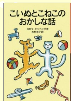
『こいぬとこねこのおかしい話』 ヨゼフ チャパック／作 木村 有子／訳 岩波書店

おそうじしたいのにこいぬ がせっけんをたべちゃった！ どうやっておそうじし よう？ そうだ、ぬれたゆかを こいぬでこすって、仕上げ に、こねこでふいちゃおう！