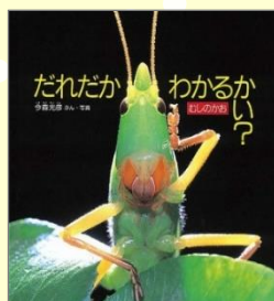
『だれだかわかるかい？ むしのかお』 今森 光彦／ぶん 写真 福音館書店

むしのかおって じつはみんなちがうんだ。 大きなしゃしんで バッタやカブトムシの かおをみてみよう。