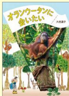
『オランウータンに会いたい』 久世 濃子／著 あかね書房