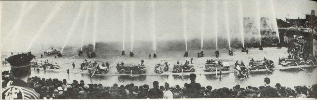
出 初 式