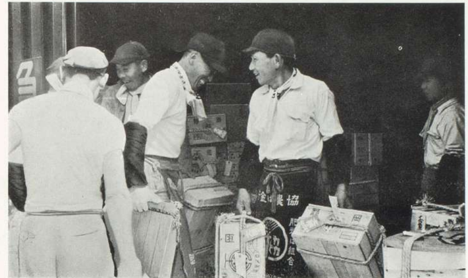
特産メロンの出荷