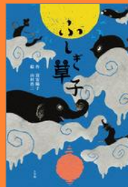
『ふしぎ草子 あやしくもふしぎな八つの物語』 富安 陽子 作 山村 浩二 絵 小学館

だれもいないはずの午後の学校、わすれられた音楽室からピアノの音が。そこで野中先生が見たものとは？ふしぎな世界をのぞいてみて。