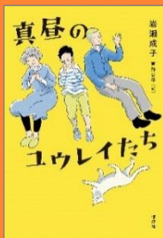
『真昼のユウレイたち』 岩瀬 成子 作 芦野 公平 絵 偕成社