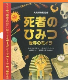
『死者のひみつ』 マット ラルフス 文 大英博物館 監修 ゴールディ ライト 絵 山根 玲子 訳 和田 浩一郎 日本語版監修 BL出版

世界各地で発見されているミイラや人骨。それらが教えてくれる当時の人々のくらしや考え方にふれてみよう。