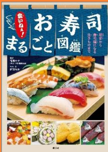
『おいねえ！お寿司まるごと図鑑』 阿部 秀樹 写真 文 偕成社