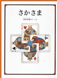
『さかさま』 安野 光雅 さくえ 福音館書店