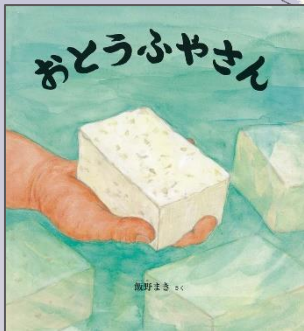
『おとうふやさん』 飯野まき さく 福音館書店

とうふができるまでを のぞいてごらん。 みずにいれてやわらかく なっただいずをつぶして、 それからね...だいずから とうふになるまでがよく わかります。