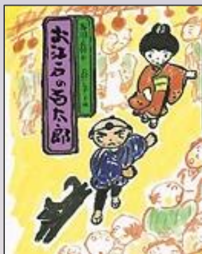
『お江戸の百太郎』 那須正幹 作 長野ヒデ子 画 岩波書店