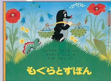
『もぐらとずぼん』 エドアルド・パチシカ ぶん ズデネック・ミレル え うちだりさこ やく 福音館書店

もぐらは、あおいずぼん がどうしてもほしくて、 どうしたら、てにはいる のかをかんがえます。