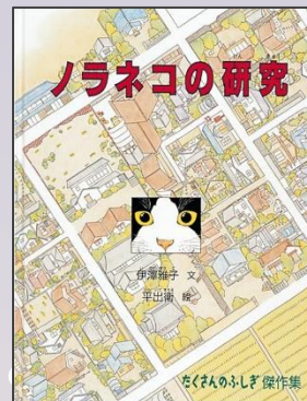
『ノラネコの研究』 伊沢雅子 文 平出衛 絵 福音館書店

たよりにならない親分 のかわりに、はんんにんを つかまえろ! キレ者でしっかりむすこの 百太郎がかけぬける!!