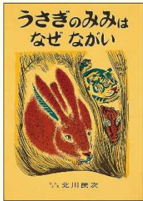
『うさぎのみみはなぜながい』 (メキシコ民話) 北川 民次 // ぶんとえ 福音館書店