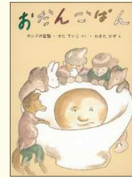
『おだんごぱん』 (ロシアの昔話) せたていじ // やく わきたかず // え 福音館書店