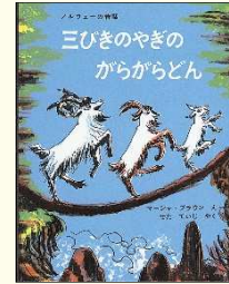
『三びきのやぎのがらがらどん』 (ノルウェーの昔話) マーシャ・ブラウン // え せたていじ // やく 福音館書店