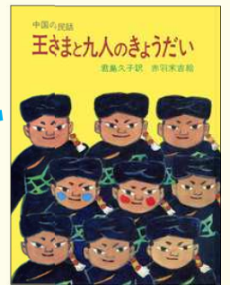
『王さまと九人のきょうだい』 (中国の民話) 君島久子 // 訳 赤羽末吉 // 絵 岩波書店