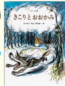
『きこりとおおかみ』 (フランス民話) 山口智子 // 再話 堀内誠一 // 画 福音館書店