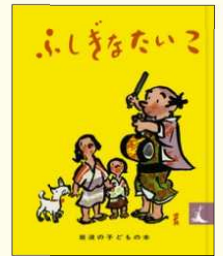
『ふしぎなたいこ』 (日本の昔話) 石井桃子 // 著 清水崑 // え 岩波書店