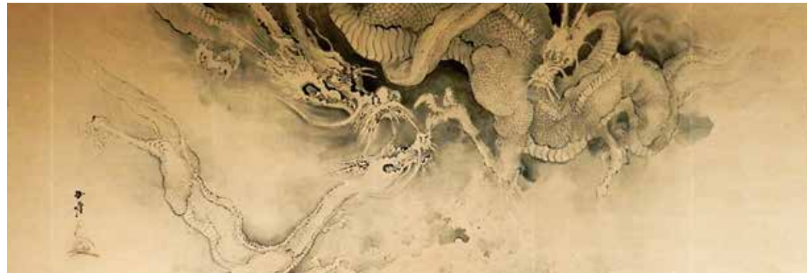
雲龍圖 (本堂左) 龍巢院