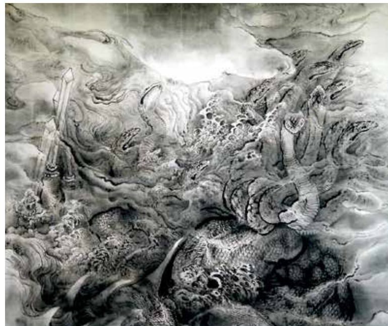
十二頭三尾三劍之圖