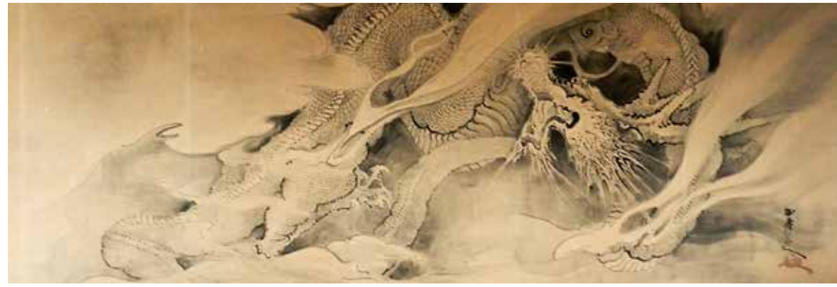
雲龍圖 (本堂右) 龍巢院