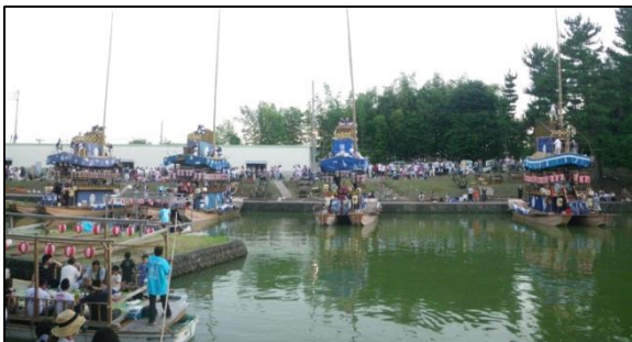
川祭の始まりを待つ旧津島湊の賑わい(愛知県津島市)

これについては、86回で紹介したが、江戸時代になると「津島御師(つしまおし)」と呼ばれる宗教者が各地を廻って津島牛頭天王の功德を宣伝し布教したことから、遠州の河川流域の各村では「津島講」と呼ばれる講が組織され、御師による配札が行われた。各村では祇園の祭礼の日に杉の御仮屋を設け、中にこの御札を祀って村中の厄を集める祭礼を夜通し行い、翌朝、御仮屋を川に流して村内を浄化した。津島神の神事は川祭を行うところに特徴があるわけだ。(山)