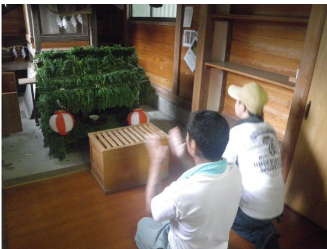
磐田市富里のオカリヤ

村の鎮守である諏訪神社の境内では、七月中旬の日曜日に、今も祇園の行事としてオカリヤを作っている。その内容は、朝から新竹と杉の葉で作られ、完成すると本殿前に設置し、津島神社の御札を祀って提灯を飾り、御神酒を供えて、参加者が順番に参拝して終わるというものである。現在は、境内の林の中に捨てられ朽ちるのを待つが、本来は祭礼終了後、天竜川に運び、村内の厄と共に流していた。(山)